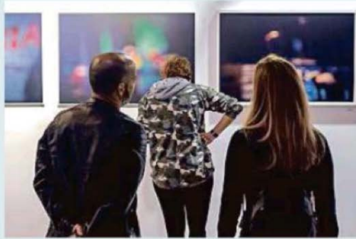
El evento busca promover el coleccionismo en Nuevo León.

Con el propósito de incentivar el coleccionismo y el mundo del arte en Monterrey, desde el año pasado nació la Feria de Arte Mexicano Accesible (FAMA) y ahora abre su convocatoria a creativos nacionales e internacionales para participar en su segunda edición, que se realizará del 8 al 10 de noviembre, en la capital norteamericana.